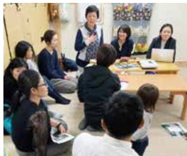
11月8日には、子育て世代の皆さんと、カジノ誘致をめぐる国や横浜市の動向や市議会の議論を共有し意見交換しました。