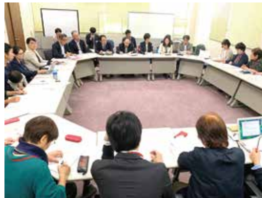
円卓会議には小さな赤ちゃん、子どもたちも含めて約20人が参加。施策によって市の担当課が異なるため大ぜいの職員も参加し会議室はいっぱい。

より身近な場所で一時保育を利用できるよう、認可保育所における一時保育の充実や、乳幼児一時預かり事業の拡大が必要です。今年度中に策定される「第2期横浜市子ども・子育て支援事業計画」素案も踏まえた中期的な視野を持って提案を続けます。