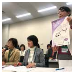
香害アクションで厚労省等と意見交換