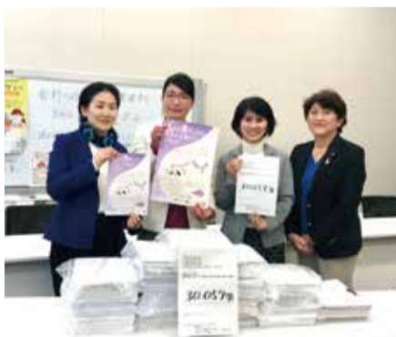
内閣総理大臣、文部科学大臣、厚生労働大臣、経済産業大臣、内閣府特命担当大臣あて要望を提出

12月14日には、「柔軟仕上げ剤など、家庭用品に含まれる香料の成分表示等を求める要望」を全国から寄せられた30,057筆の署名と共に提出。今後も成分表示の義務化や、香料使用の自粛に向けた啓発事業の推進を求めています。