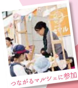
つながるマルシェに参加