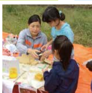
子ども達と石けんワークショップ