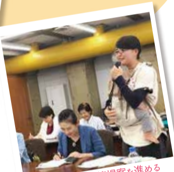
横浜市への政策提案を進める