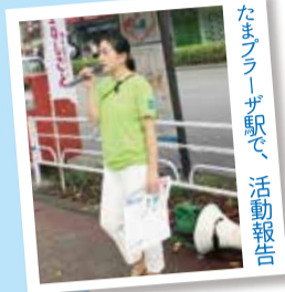
たまプラーザ駅で活動報告