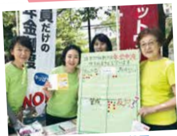
「議員年金」シール投票